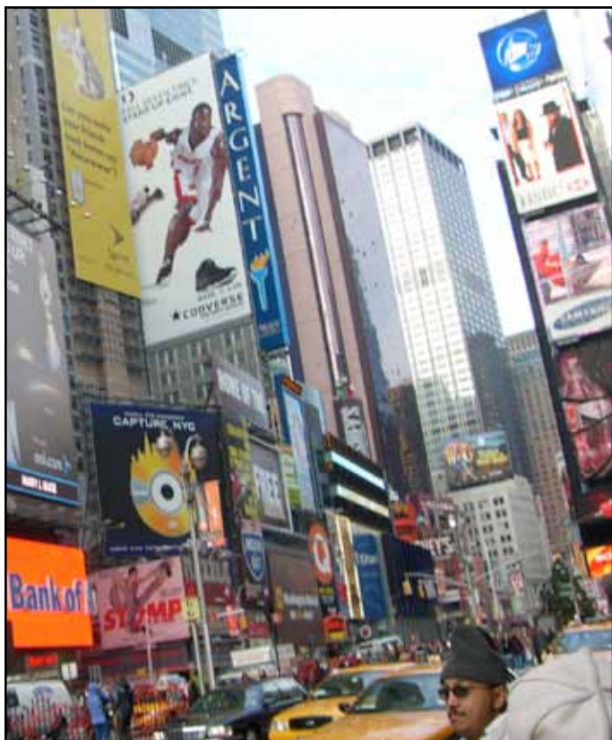
Times Square - moren til all lysreklame.

Hva med å jogge i Central Park ? Forrige gang jeg jogget der, møtte jeg filmstjernen Scarlett Johanssen på veien. Men jeg tror ikke hun forteller til noen at hun har møtt meg. Er du ikke i treningshumør så kan man jo leie en båt og dra ut på vannet i parken. Veldig romantisk! Man kan visstnok også få seg en gondoltur styrt av en opera-syngende gærning. Central Park er en viktig grønn lunge for New Yorkere. Den gir et avbrekk fra den hektiske rytmen som preger byen. For øvrig skal det tilføyes at den er kunstig bygget.