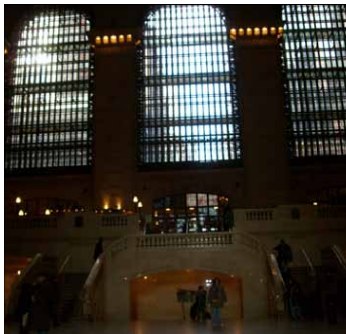
Grand Central Station. Ikke akkurat Oslo S.

Grand Central Station. Byens hovedtogstasjon. Du har sett den i en rekke filmer. Og visst er den fantastisk. Ta en tur innom bare for å kikke. Eller spis lunsj i underetasjen.